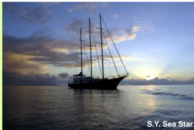
S.Y. Sea Star

Embarquement à l'Inter Island Quay à 1030hrs, Après l'accueil à bord suivi d'un commentaire du Capitaine, départ à 1200hrs vers l'île Ronde proche de Praslin. Arrivée, en fin d'après-midi pour un diner barbecue à bord.