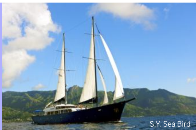
S.Y. Sea Bird