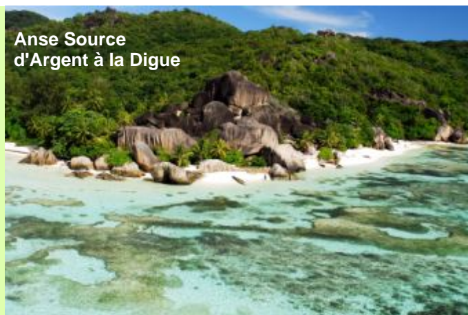
Anse Source d'Argent à la Digue

Navigation en matinée vers la Digue, une petite île où l'on se laisse bercer par le rythme lent des chars à boeufs et où les bicyclettes sont aussi le moyen de transport courant dans l'île. La Digue est le refuge du petit gobe-mouches endémique, la veuve du Paradis des Seychelles. La Digue est aussi célèbre pour ses énormes formations de blocs de granit d'Anse Source d'Argent, plage qui semble être la plus photographiée au monde. Découvrez l'ensemble de l'île en vélo, arrêtez-vous à Union Estate, vaste réseau traditionnel des activités de l'île comprenant une usine de coprah, plantation de vanille et le chantier naval.