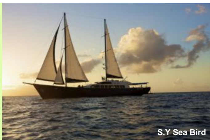
S.Y Sea Bird

Cap vers l'île Booby pour une matinée de plongée et d'activités nautiques. Après le déjeuner, navigation vers l'île Aride, l'une des plus belles réserves naturelles avec le plus d'espèces d'oiseaux marins que sur les autres îles qui s'y réfugient pour nicher. Cinq variété d'oiseaux endémiques et la plus grande population de trois espèces. Le sentier mène à une spectaculaire falaise, point de vue de la plus grande population de Frégates après l'île d'Aldabra. Aride est le seul endroit naturel de la planète où poussent les gardenias de Wright (le célèbre bois citron) et où 400 espèces de poissons ont été enregistrés autour de l'île.