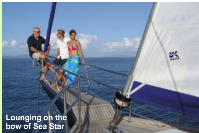
Lounging on the bow of Sea Star

Après le petit déjeuner, navigation retour vers Mahé. Nous nous arrêterons à l'île sèche pour une dernière occasion de palmes, masque et tuba ou plongée, barbecue à bord. Le bateau passera la nuit dans le Parc Marin de Ste Anne avant de rentrer au Port de Victoria tôt le lendemain matin.