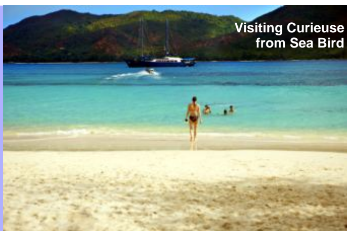
Visiting Curieuse from Sea Bird