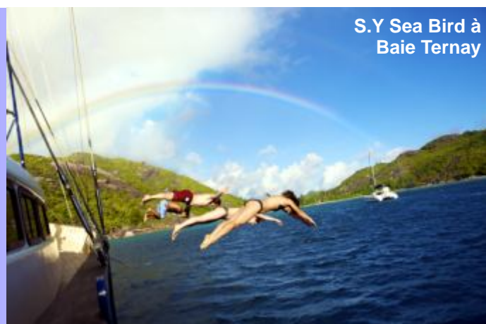
S.Y. Sea Bird à Baie Ternay