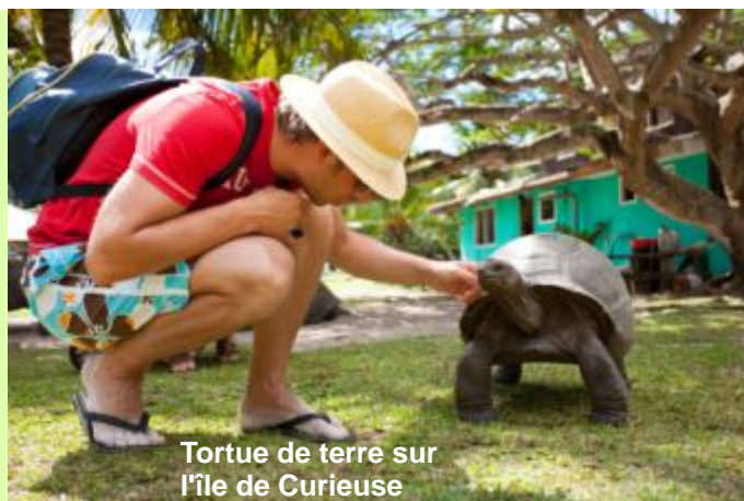
Tortue de terre sur l'île de Curieuse

Tôt dans la matinée, départ de Mahé pour l'île de Curieuse pour une visite de cette île quasiment inhabitée. Vagabondez sur les sentiers de l'île dans la vaste forêt de mangroves, la ferme de tortues géantes et les ruines historiques de l'ancienne colonie de lépreux. Après un déjeuner barbecue sur l'île, profitez d'une variété de sports nautiques ou laissez-vous à la farniente sur une magnifique plage et eau turquoise.