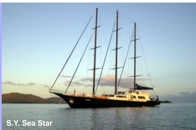
S. Y. Sea Star

Cousin fait partie d'une de ces seules îles sur laquelle on trouve la pie chanteuse, un des plus rares oiseaux du monde