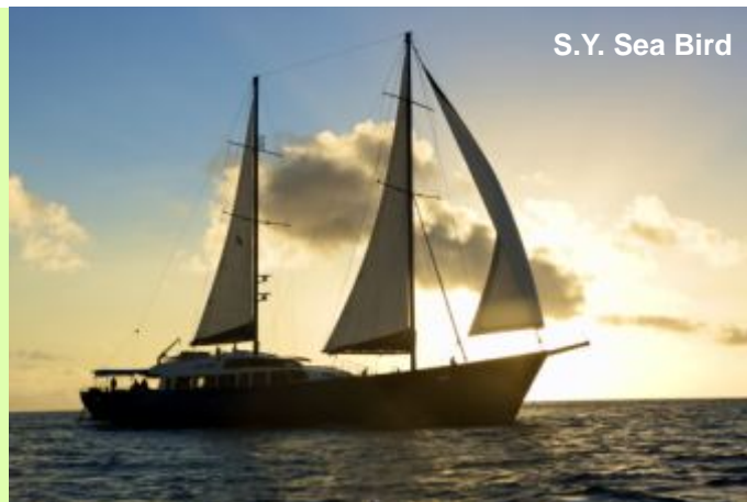
S.Y. Sea Bird

Embarquement à Inter Island Quay à 1030hrs suivi d'une présentation et commentaire du Capitaine. Départ de Victoria à 1200hrs, navigation le long des côtes nord de Mahé, en passant dans la magnifique baie de Beau-Vallon et longeant la spectaculaire côte nord-ouest de l'île, avec ses formations de granit, végétation luxuriante et eau turquoise. Dans la soirée, dîner barbecue à bord.