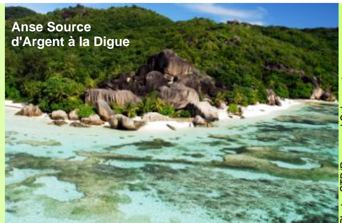
Anse Source d'Argent à la Digue

Navigation en matinée vers la Digue, une petite île où l'on se laisse bercer par le rythme lent des chars à boeufs et où les bicyclettes sont aussi le moyen de transport courant dans l'île. La Digue est le refuge du petit gobe-mouches endémique, la veuve du Paradis des Seychelles. La Digue est aussi célèbre pour ses énormes formations de blocs de granit d'Anse Source d'Argent, plage qui semble être la plus photographiée au monde. Découvrez l'ensemble de l'île en vélo, arrêtez-vous à Union Estate, vaste réseau traditionnel des activités de l'île comprenant une usine de coprah, plantation de vanille et le chantier naval.