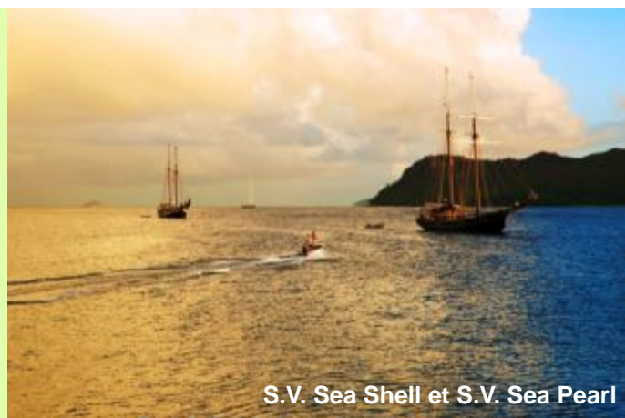
S.V. Sea Shell et S.V. Sea Pearl

Cap vers l'île Booby pour une matinée de plongée et d'activités nautiques. Après le déjeuner, navigation vers l'île Aride, l'une des plus belles réserves naturelles avec le plus d'espèces d'oiseaux marins que sur les autres îles qui s'y réfugient pour nicher. Cinq variété d'oiseaux endémiques et la plus grande population de trois espèces. Le sentier mène à une spectaculaire falaise, point de vue de la plus grande population de Frégates après l'île d'Aldabra. Aride est le seul endroit naturel de la planète où poussent les gardenias de Wright (le célèbre bois citron) et où 400 espèces de poissons ont été enregistrés autour de l'île.