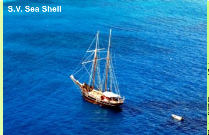
S.V. Sea Shell

Embarquement à l'Inter Island Quay à 1030hrs, Après l'accueil à bord suivi d'un commentaire du Capitaine, départ à 1200hrs vers l'île Ronde proche de Praslin. Arrivée, en fin d'après-midi pour un diner barbecue à bord.